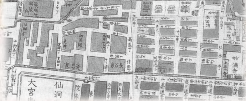
1875年（明治8年）頃の病院